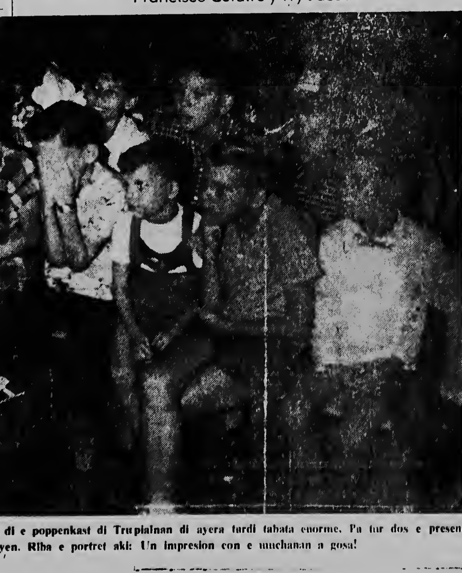
E animacion pa e dos presentacionnan di e poppenkast di Trupialnan di ayera tardi tabata enorme. Pa tur dos e presentacionnan e sala tabata completamente yen. Riba e portret aki: Un impresion con e muchanan a gosa!